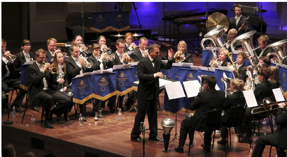
Det er om lag 30 musikere i brassbandet Eikanger-Bjørsvik Musikklag.