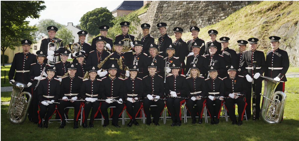
Norges største profesjonelle militærkorps - Forsvarets Stabsmusikkorps - har 39 musikere.

3 kornetter 2 trompeter 3 tromboner eufonium tuba pauker skarp tromme, basstromme, cymbaler, triangel, tamburin