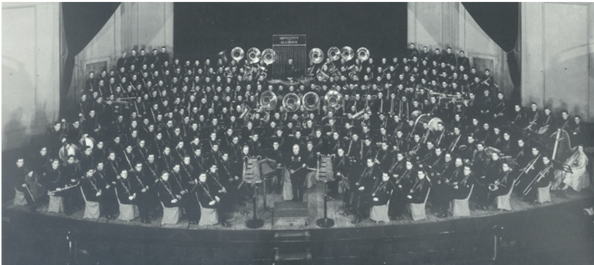
Gigantisk - University of Illinois Concert Band - bildet er fra 1932.