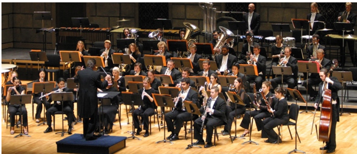
Ingen doblinger - Eastman Wind Ensemble er kjent for å bare ha en musiker per stemme.