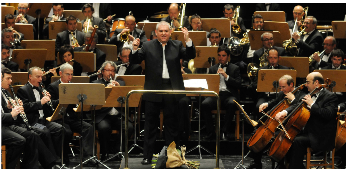
Cello i korps - Banda Sinfonica Municipal de Madrid har cellogruppe i sin faste besetning.

I Spanske komposisjoner og arrangement for Banda Sinfonica er det vanlig med cello-gruppe. Cellogruppe forekommer for øvrig også en del i nederlandske janitsjarbesetninger men er mindre vanlig i andre land og det er ikke tradisjon for dette i Norge. Banda Sinfonica -besetningen er ellers så lik at det er riktig å betrakte den som en variant blant de janitsjarbesetningene.